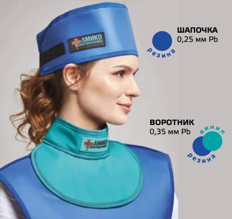
ШАПОЧКА 0,25 мм Pb РЕЗИНА