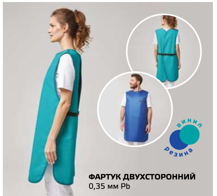
ФАРТУК ДВУХСТОРОННИЙ 0,35 мм Pb ВИНИЛ РЕЗИНА