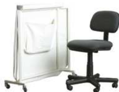
ШИРМА МАЛАЯ ДЛЯ ЗАЩИТЫ ВРАЧА (С КРЕСЛОМ)

Производитель оставляет за собой право вносить изменения в комплектацию, технические характеристики и внешний вид оборудования. Продукция зарегистрирована и разрешена к применению на территории Российской Федерации.