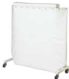
ШИРМА МАЛАЯ ДЛЯ ЗАЩИТЫ ВРАЧА (ХИРУРГИЧЕСКАЯ)