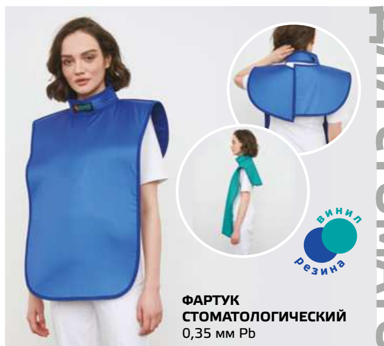
ФАРТУК СТОМАТОЛОГИЧЕСКИЙ 0,35 мм Pb ВИНИЛ РЕЗИНА