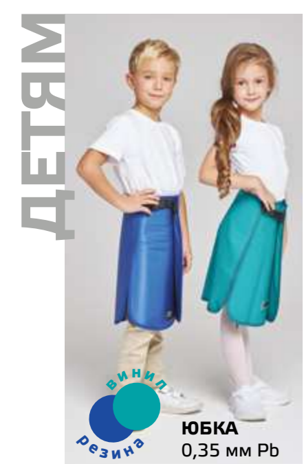
ЮБКА 0,35 мм Pb ВИНИЛ РЕЗИНА