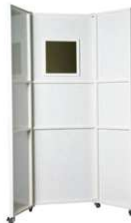
ШИРМА БОЛЬШАЯ С ЦЕНТРАЛЬНОЙ И ДВУМЯ БОКОВЫМИ ПАНЕЛЯМИ