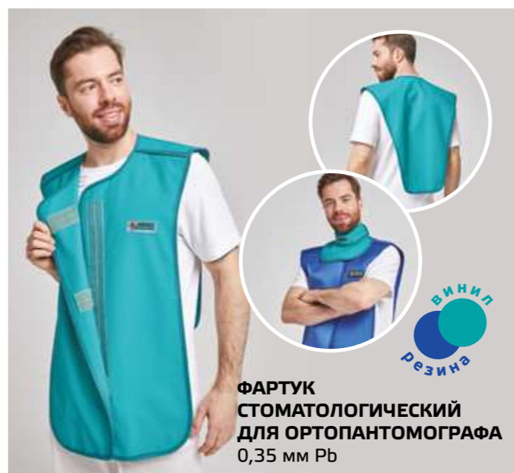
ФАРТУК СТОМАТОЛОГИЧЕСКИЙ ДЛЯ ОРТОПАНТОМОГРАФА 0,35 мм Pb ВИНИЛ РЕЗИНА