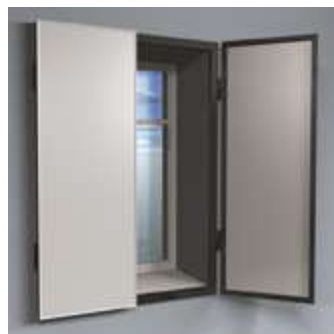
РЕНТГЕНОЗАЩИТНЫЕ ДВЕРИ ОКНА СТАВНИ