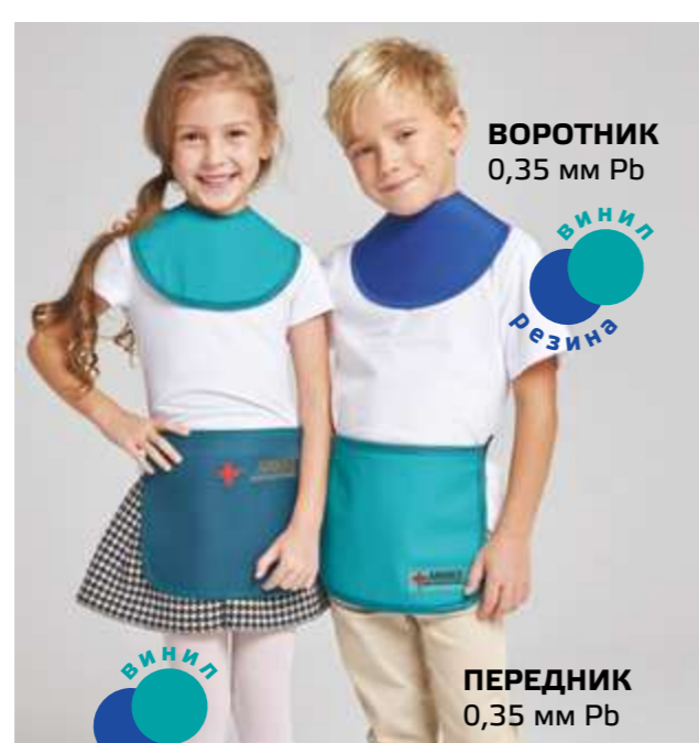
ВОРОТНИК 0,35 мм Pb ВИНИЛ РЕЗИНА