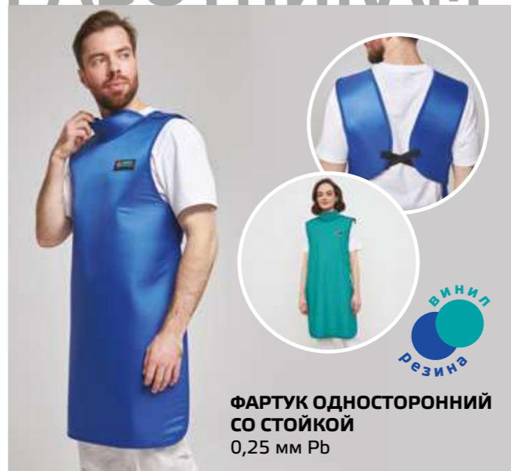
ФАРТУК ОДНОСТОРОННИЙ СО СТОЙКОЙ 0,25 мм Pb ВИНИЛ РЕЗИНА