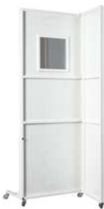
ШИРМА БОЛЬШАЯ С ЦЕНТРАЛЬНОЙ И БОКОВОЙ ПАНЕЛЯМИ