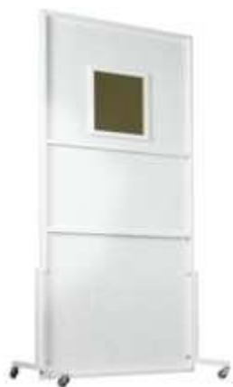
ШИРМА БОЛЬШАЯ ФРОНТАЛЬНАЯ