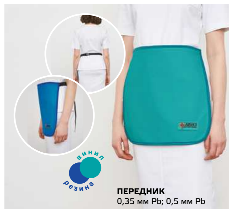
ПЕРЕДНИК 0,35 мм Pb; 0,5 мм Pb ВИНИЛ РЕЗИНА