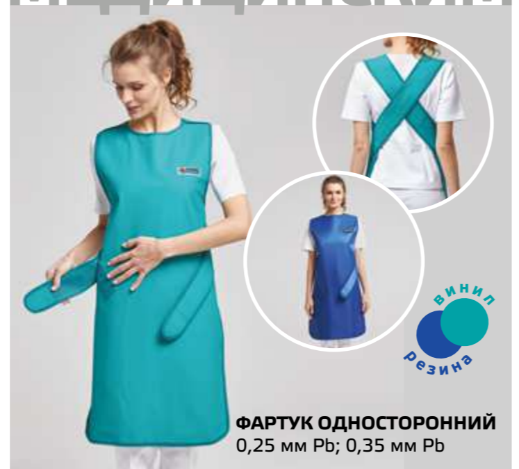
ФАРТУК ОДНОСТОРОННИЙ 0,25 мм Pb; 0,35 мм Pb ВИНИЛ РЕЗИНА