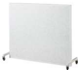
ШИРМА МАЛАЯ ДЛЯ ЗАЩИТЫ ПАЦИЕНТА