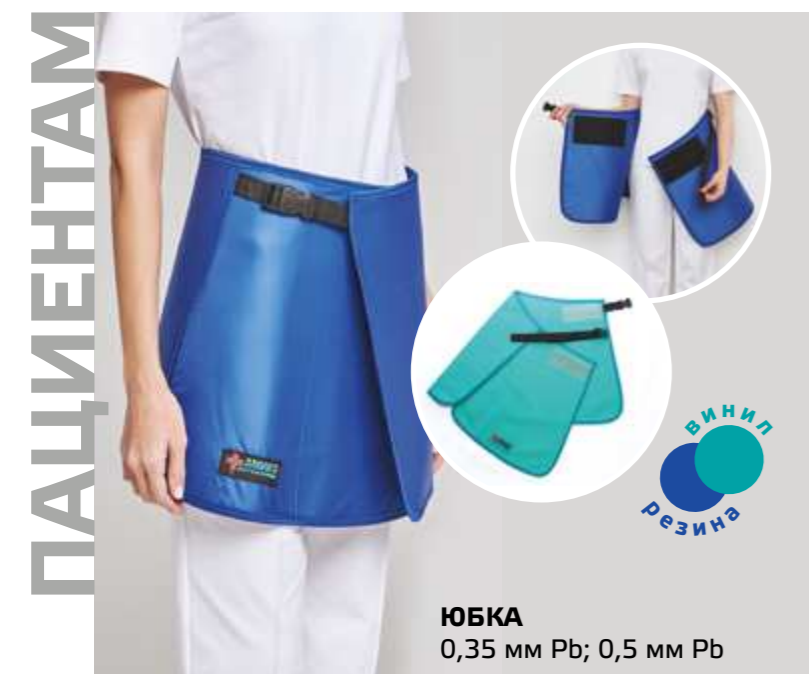
ЮБКА 0,35 мм Pb; 0,5 мм Pb ВИНИЛ РЕЗИНА